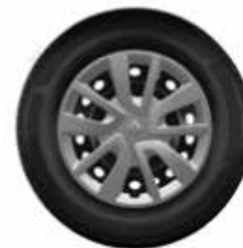
tazas Magiceo 15"