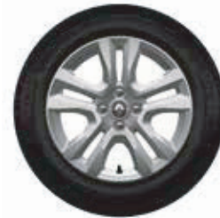
Llantas de aleación Jogger 16"