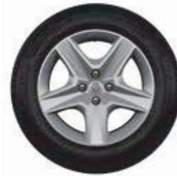
Llantas Flexwheel Oasis 16"