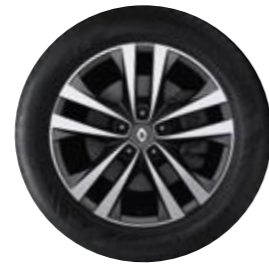
NUEVO RIN 18" BI-TONO