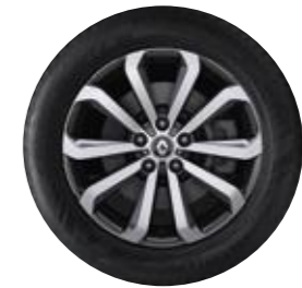
NUEVO DISEÑO RIN 18" BI-TONO