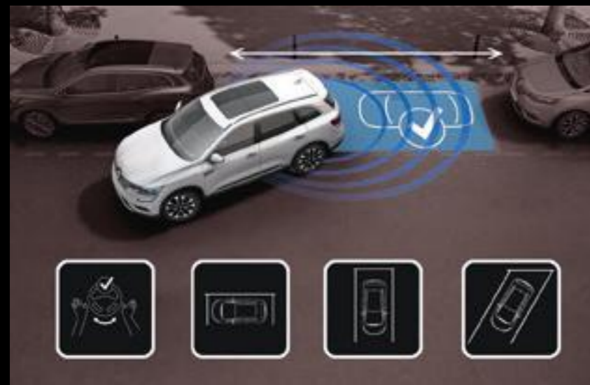
Easy Park Assist. El sistema mide el espacio y define la trayectoria. Dejá que se haga cargo del volante y estacione solo.

Una nueva era de modernidad, comodidad y seguridad te espera, gracias a la impresionante gama de asistencias al conductor que Renault ha instalado en la nueva Koleos. La Koleos analiza cada situación y activa al instante la solución tecnológica adecuada para proteger, advertir o ayudar a su conductor. Mantenete un paso por delante de los problemas con el frenado de emergencia activo, advertencia de punto ciego, asistencia de arranque en pendiente o sistemas Easy Park Assist.