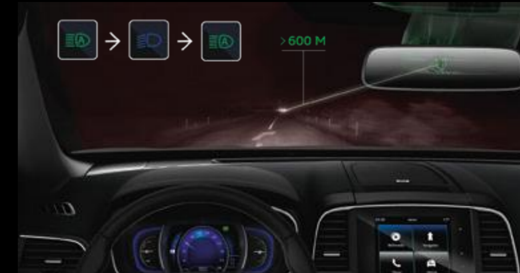
Activación automática de luces altas y bajas. Cambia automáticamente a luces altas tan pronto como ingreses a un área urbanizada o te acerques a otro vehículo desde el frente o por detrás.