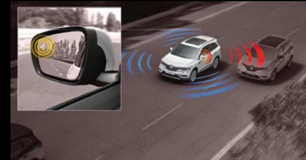
Detecta vehículos entrando en tu punto ciego. Una luz indicadora ubicada en cada uno de tus espejos retrovisores te lo advertirá.