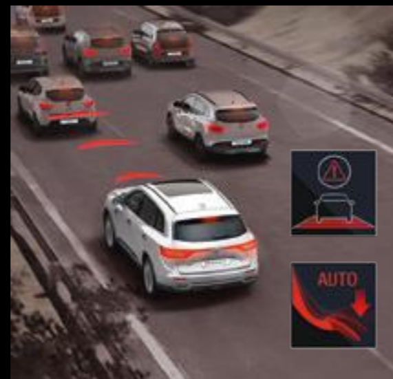
Frenado de emergencia activo. Si tienes que frenar en una emergencia, el sistema complementa el ABS / ESC para reducir las distancias de frenado.