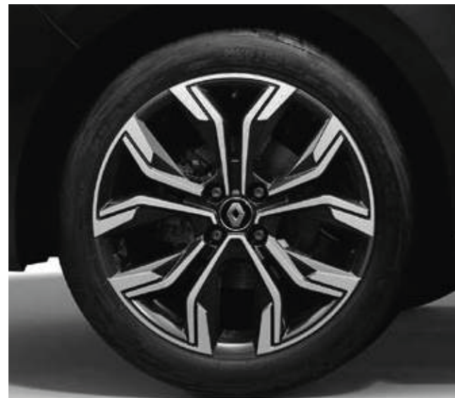
Llantas de aleación de 43 cm (17") Viva Stella Pack Look Intens (opción)