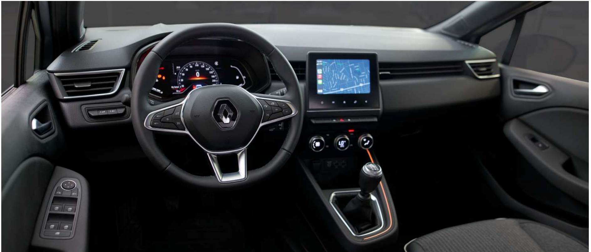
Imagen correspondiente a versión Intens.