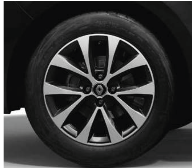
Llantas de aleación de 41 cm (16") Philia Pack Look Zen (opción)